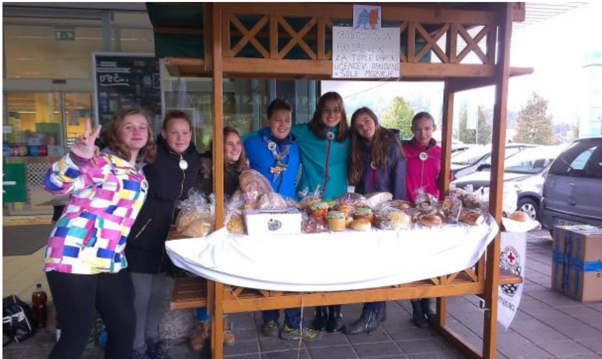
Prostovoljci OŠ Mozirje

16. oktobra je potekal Svetovni dan hrane in boja proti lakoti. Pri tem je sodelovala tudi naša šola, zato smo se učenci – prostovoljci v soboto, 17. oktobra, ob 8. uri zbrali pred trgovino Tuš. V dobrodelni akciji Drobtinica nam je tudi letos stojnico pripravil RK Mozirje. Zbirali smo denar za tople obroke učencev Osnovne šole Mozirje. Vsak mimoidoči je lahko prispeval poljubni znesek, v zameno pa izbiral med rezanci, keksi, vloženo zelenjavo, sadjem, marmelado in kruhom.