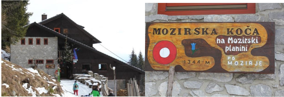
Sliki 5: Levo Mozirska koča, desno oglasna tabla

3. Jama Ledenica - Pot nadaljujemo do kraške jame, v kateri se celo leto zadržuje led, saj je v njej ves čas nizka temperatura. V starih časih so takšne jame služile kmetom in pastirjem za hrambo živil. To je le ena izmed jam, ki si jo obiskovalci lahko ogledajo, sicer pa je takih jam ob vznožju Golt še veliko, kar priča o apnenčastih tleh.