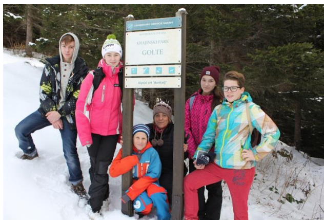
Slika 11: Člani krožka pri Alpskem vrtu