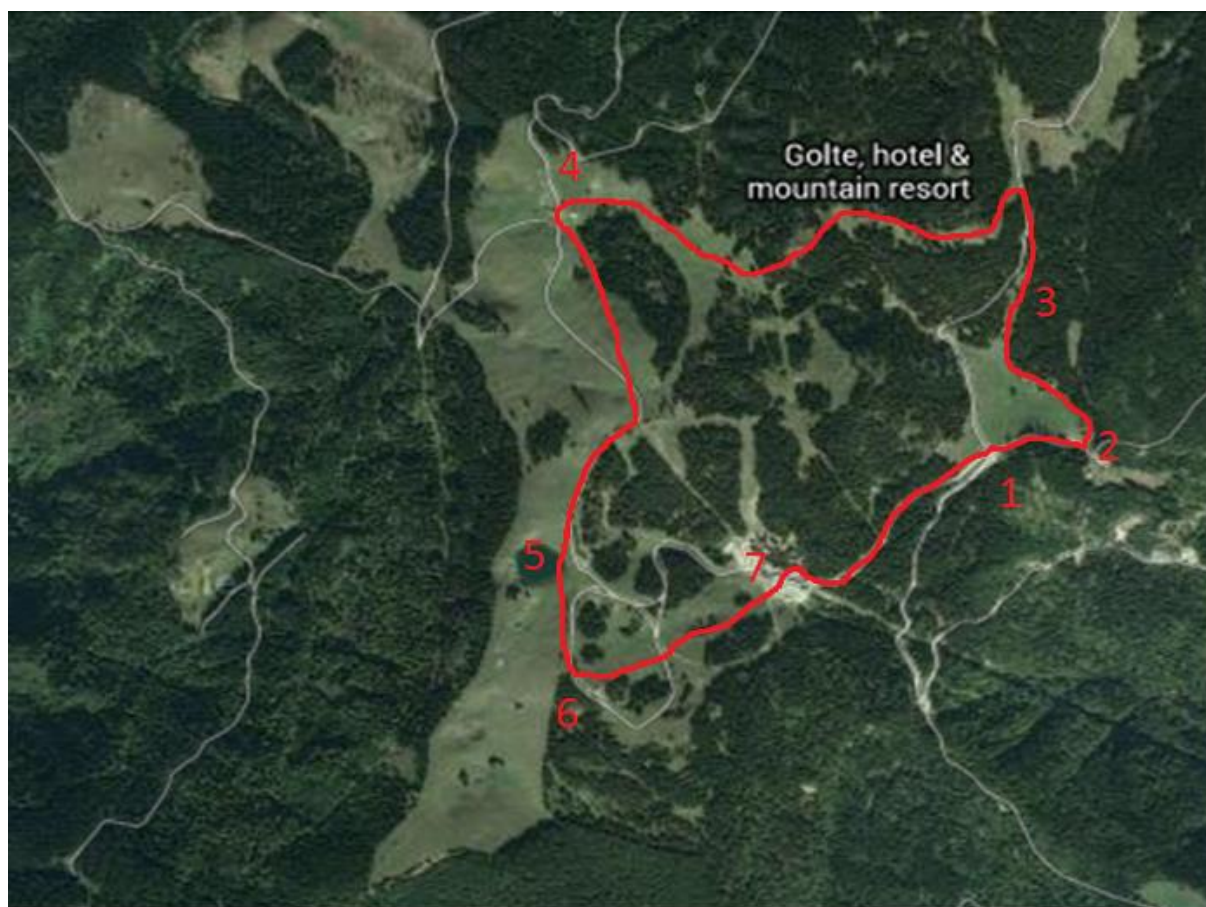
Slika 10: Zemljevid