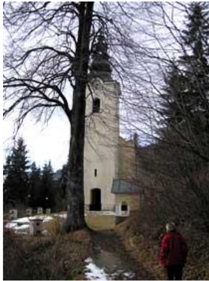
Slika 2: cerkev sv. Radegunde

Možnost A: Pešpot nas vodi mimo nekaj visoko ležečih kmetij in cerkve sv. Radegunde iz začetka 17. stoletja, ki je vredna ogleda.