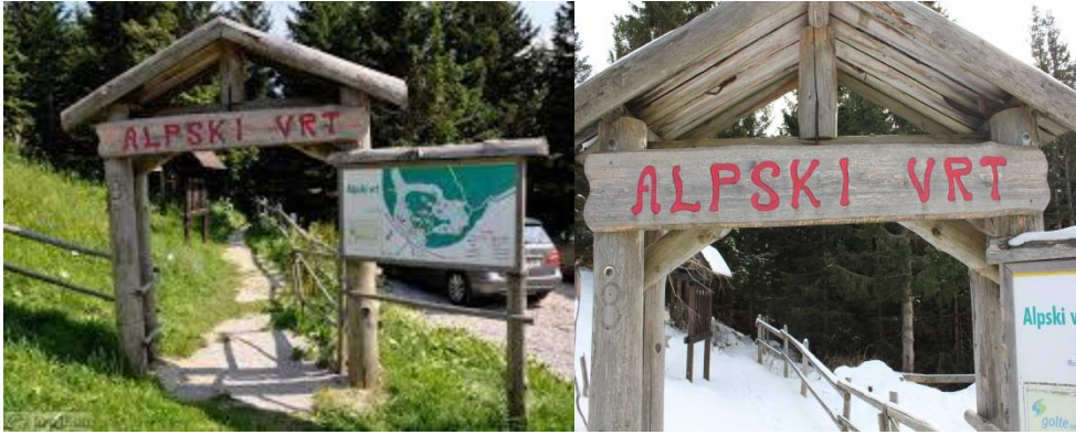
Slika 3: Alpski vrt – vhod poleti in pozimi

Po ogledu Alpskega vrta pripravimo igro »prepoznav rastlino« in čajanko za obiskovalce. Čaj skuhamo iz zdravilnih rastlin, ki rastejo v naravnem okolju parka, in ga ponudimo obiskovalcem. Ob čaju ponudimo nekaj tradicionalnih jedi Zgornje Savinjske doline, kot so: savinjski želodec, domači kruh in orehova potica. Ta del poti, igro in pogostitev bomo prikazali v okviru tržnice Turizmu pomaga lastna glava.