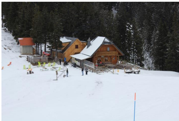
Slika 7: Koča Trije ploti