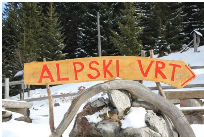
Slika 4: Ob vhodu v Alpski vrt

Po ogledu Alpskega vrta pripravimo igro »prepoznav rastlino« in čajanko za obiskovalce. Čaj skuhamo iz zdravilnih rastlin, ki rastejo v naravnem okolju parka, in ga ponudimo obiskovalcem. Ob čaju ponudimo nekaj tradicionalnih jedi Zgornje Savinjske doline, kot so: savinjski želodec, domači kruh in orehova potica. Ta del poti, igro in pogostitev bomo prikazali v okviru tržnice Turizmu pomaga lastna glava.