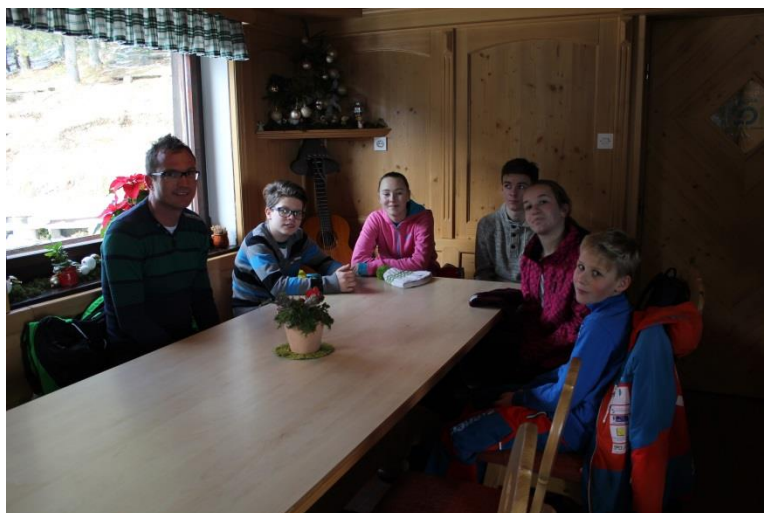
Slika 13: V koči