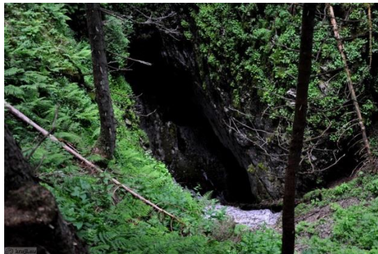
Slika 6: Jama Ledenica

3. Jama Ledenica - Pot nadaljujemo do kraške jame, v kateri se celo leto zadržuje led, saj je v njej ves čas nizka temperatura. V starih časih so takšne jame služile kmetom in pastirjem za hrambo živil. To je le ena izmed jam, ki si jo obiskovalci lahko ogledajo, sicer pa je takih jam ob vznožju Golt še veliko, kar priča o apnenčastih tleh.