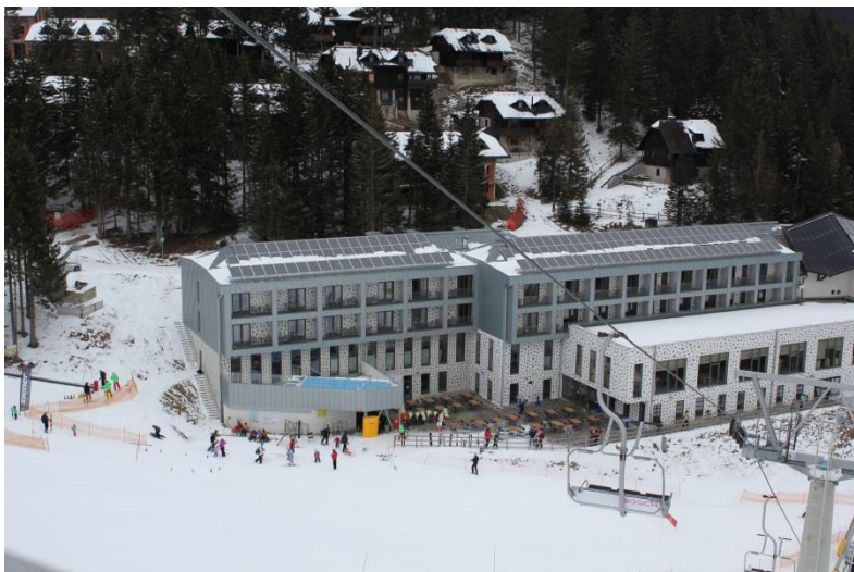
Slika 9: Hotel Golte