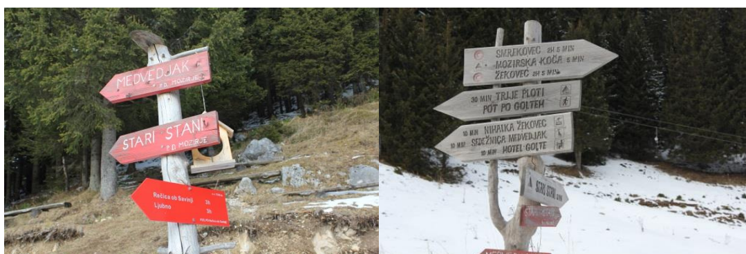
Sliki 25: Smerokazi