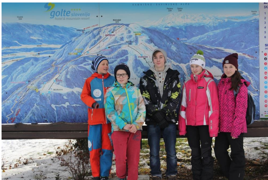
Slika 1: člani krožka pred začetkom pohoda

Skupaj s predsednikom društva smo se odločili, da bomo obiskali turistični center Golte, nato pa bomo izdelali učno tematsko pot, ki bo primerna za mlajše in starejše obiskovalce.