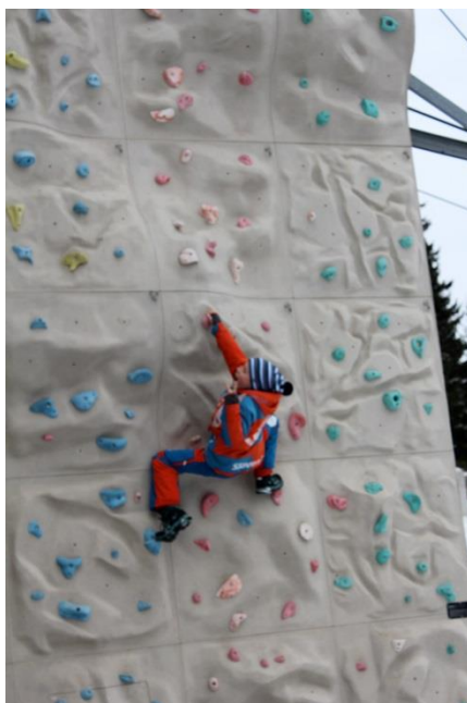
Slika 16: Plezalna stena pri hotelu