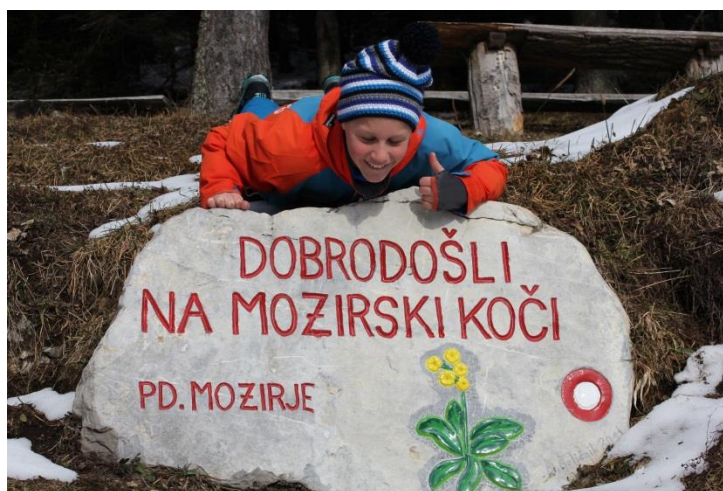
Slika 12: Ob vhodu v kočo