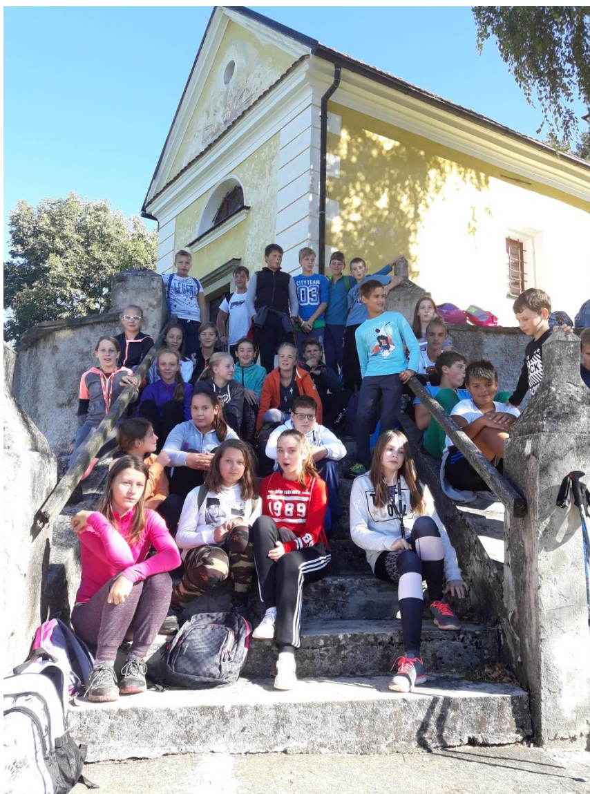
Sedmošolci pri cerkvi svetega Urbana na Dobrovljah

V mrzlem jutru smo se vsi učenci najprej zbrali pred šolo, pomalicali, nato pa smo se odpravili vsak v svojo smer. Sedmošolci smo se najprej sprehodili ob Savinji do Nazarij, ki so bile naše izhodišče za pohod do cerkve svetega Urbana na Dobrovljah. Dobrovlje so prostrana planota, ki se razprostira vzhodno od Menine planine. Pot nas je vodila čez gozdove, naše zanimanje pa so pritegnile stare zapuščene kmetije, ki so imele prav poseben čar. Čez kakšno uro in pol prijetne hoje smo že bili na cilju. Na stopnicah pred cerkvico smo pomalicali in si nato ogledali zunanost cerkve. Želeli smo si ogledati tudi, kaj se skriva za velikimi vrati, a so bila na žalost zaklenjena.