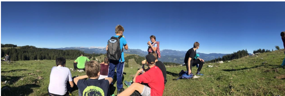
Osmošolci na Menini

Na Dobrovljah smo preživelih prekrasen sončen dan in zagotovo se tja še vrnemo.