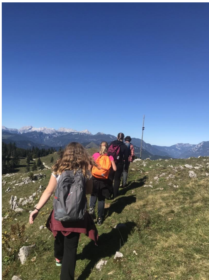
Lahkih nog po Menini